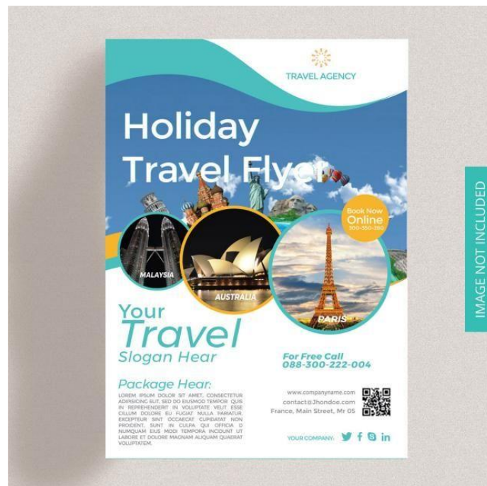
Exemple de flyer faisant la promotion du tourisme